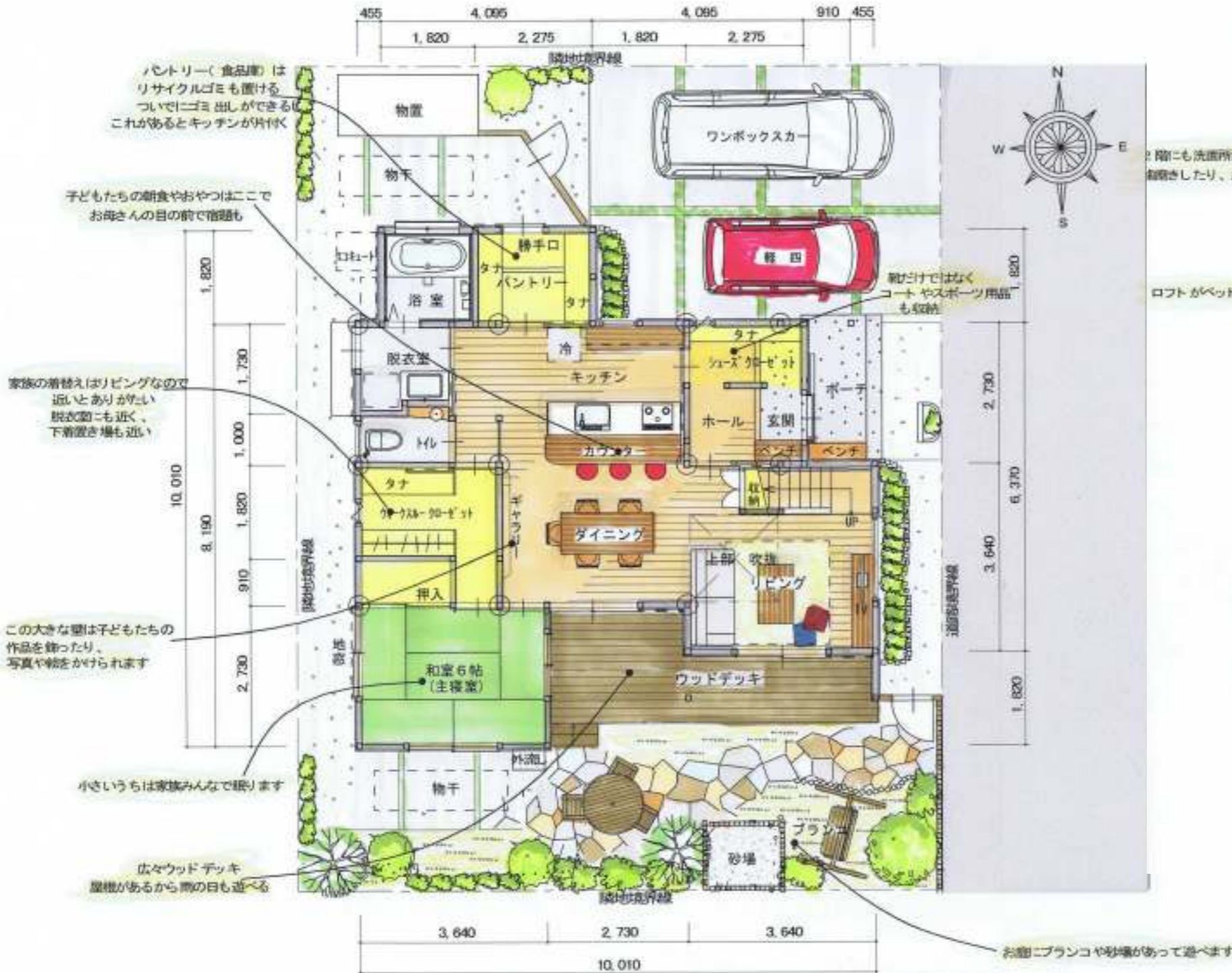
配置図 * 1階平面図 S=1/100